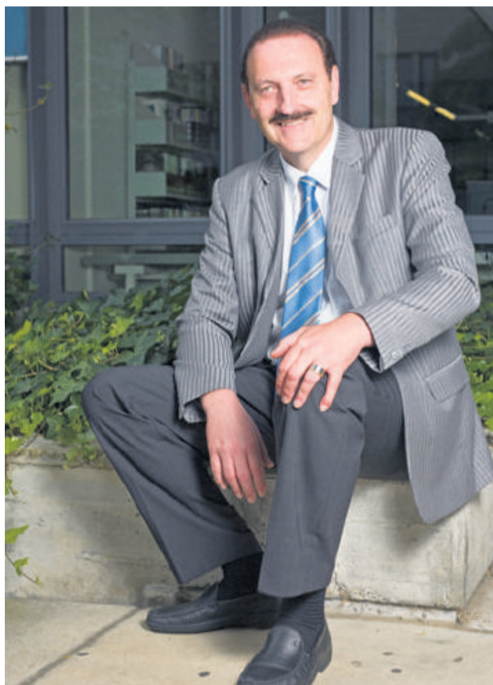
Beat W. Zemp estime notamment que les jeunes n'épargnent pas suffisamment pour leurs vieux jours...

A la tête du LCH depuis 1990, Beat W. Zemp enseigne encore les maths quelques heures par semaine. Il est bien placé pour savoir que l'école ne peut pas tout résoudre et que les profs, aujourd'hui, sont déjà confrontés à de grosses difficultés. Mais il est convaincu qu'ils ont une carte à